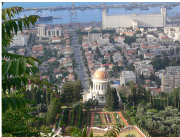
Blick auf Bahai-Garten/-tempel und Hafen in Haifa