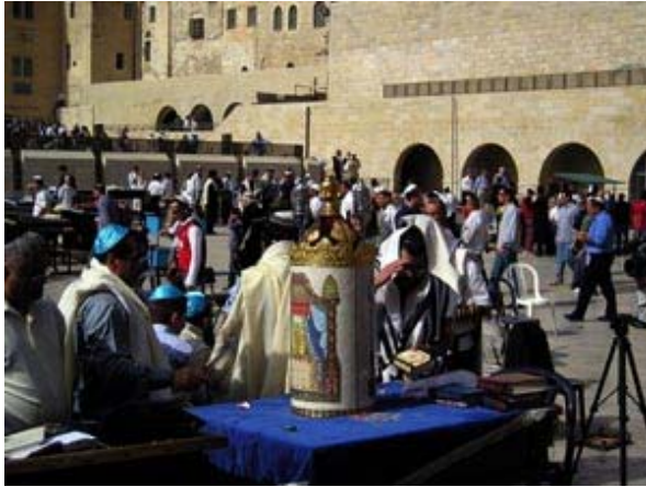
Die Gläubigen mit der Thora-Rolle an der Westmauer

Vorbei an Beersheva geht es weiter nach Jerusalem . Dort fahren wir am frühen Morgen auf den Ölberg und wandern runter zum Garten Gethsemane und besuchen die Kirche der Nationen . Im Außenministerium sind wir herzlich willkommen und führen Gespräche über die aktuellen Bedrohungen Israels , den israelisch-palästinensischen Konflikt und die deutsch-israelischen Beziehungen . Auch ein Besuch der Knesset ist eingeplant.