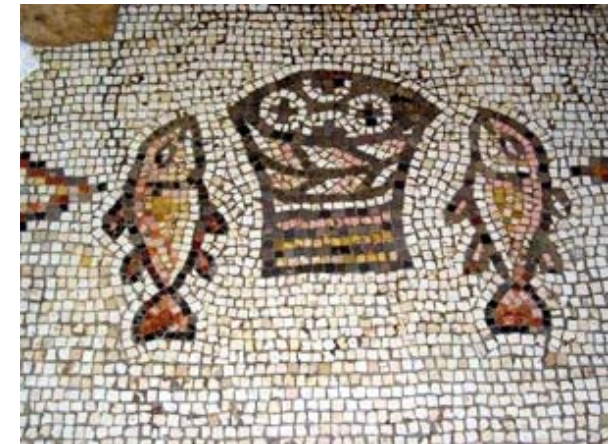
Mosaik in der Brotvermehrungskirche in Tabgha