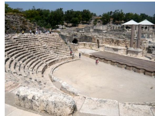
Blick auf das röm. Amphitheater von Beit Shean

Qumran (Fundort der ältesten Schriftrollen) und die Festung Massada (Symbol für jüdische Selbstbehauptung) sind ebenfalls mit im Programm.